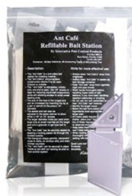
ANT CAFE INDOOR BAIT STATION