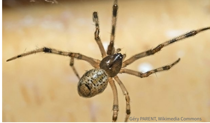
Géry PARENT, Wikimedia Commons

L'araignée domestique commune est originaire d'Amérique du Sud, mais elle est maintenant présente dans tous les États contigus des États-Unis et s'est déplacée jusqu'au sud du Canada, transportée dans les plantes. Elle vit principalement près des humains, ce qui en fait l'une des araignées qui tissent le plus souvent des toiles à l'intérieur. L'araignée domestique commune appartient à une famille d'araignées qui abandonne fréquemment sa toile pour en construire une autre à proximité. La poussière qui se dépose sur les toiles abandonnées crée des filaments, qui s'accumulent s'ils ne sont pas enlevés souvent.