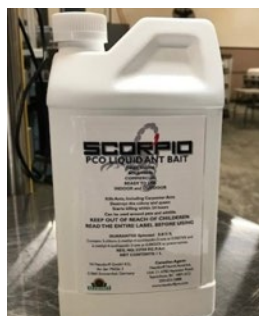
SCORPIO LIQUID ANT BAIT