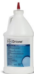
DRIONE INSECTICIDE DUST