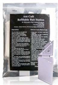
POINT D'APPÂT POUR L'INTÉRIEUR ANT CAFE 781399 - SAC - 24.00$