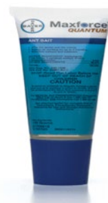
MAXFORCE QUANTUM ANT BAIT