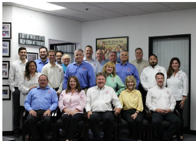
Famille Bird B Gone Irvine, Californie, au-dessus; En 1995, Bird B Gone a breveté l'épi en plastique original, en haut à gauche

En outre, comme nous possédons et exploitons notre usine de fabrication aux États-Unis, nous avons le contrôle sur nos processus de fabrication. Cela permet Nous devons faire en sorte que la production se déroule sans heurts, fournir les produit de qualité au coût le plus bas possible, offrir notre des garanties de premier ordre pour les clients ainsi que les options d'expédition le jour même.