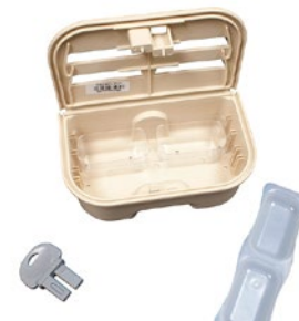
INSECT BAIT STATION 4/BG