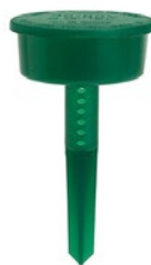
ANTS-NO-MORE BAIT STATION