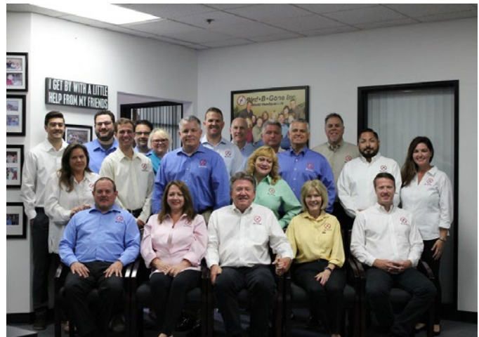
Bird B Gone Family Irvine, California, above; In 1995, Bird B Gone patented the original Plastic Bird Spike, top left

I believe our people/expertise, products, and manufacturing capabilities are what differentiate us the most. Together, our team has over 90 years of combined hands-on experience in this industry. Our real world experience allows us to help our customers both in the field and on the phone. Product innovation, quality, and performance are also key. We aren't about gimmicks. We are about reliable solutions that actually work. We currently have 65 issued patents worldwide and other 30+ pending. In addition, since we own and operate our manufacturing facility in the United States, we have control over our manufacturing processes. This allows us to run production smoothly, provide the highest quality product at the lowest possible cost, offer our customers industry-leading guarantees as well as same-day shipping options.