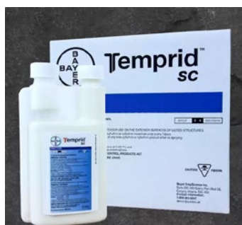
TEMPRID SC, 400 ML, 6/ CAISSE 797806 - BOUTEILLE - 220.00$